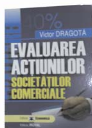
Evaluarea acțiunilor societăților comerciale