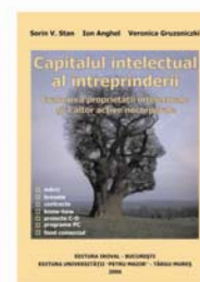
Capitalul intelectual al întreprinderii Evaluarea proprietății intelectuale și a altor active necorporale

IROVAL - CERCETĂRI ÎN EVALUARE S.R.L. Tel / Fax: 021/311 27 82; e-mail: daniela.moldoveanu@anevar.ro C.U.I. R 7985707 Cont: RO56RNCB0072049694060001 Deschis la: BCR - sect. 1, București