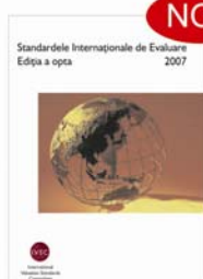
Standardele Internaționale de Evaluare