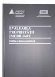
Evaluarea proprietății imobiliare