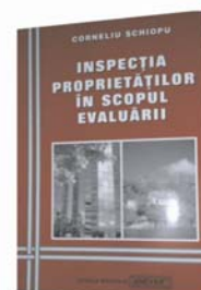
Inspecția proprietăților în scopul evaluării