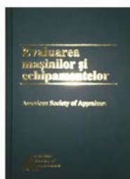
Evaluarea mașinilor și echipamentelor